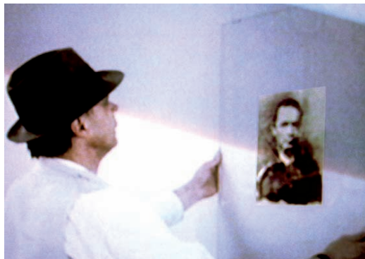
Joseph Beuys und Rudolf Steiner, 1973

Mit dem Satz: „Jeder Mensch ist ein Künstler“ rückte Joseph Beuys ins allgemeine Bewusstsein, dass jede Handlung künstlerisch gelöst werden kann. Damit knüpft er an Rudolf Steiner an, der den Ausdruck „Soziale Kunst“ geprägt und statt von Pädagogik von „Erziehungskunst“ gesprochen hat. Gleichzeitig schuf Beuys Objekte von enormer gesellschaftlicher Wirkung, zu denen jedoch nicht jedermann leicht einen Zugang findet. An die sich auf diesem Feld ergebenden Fragen soll eine Annäherung versucht werden.